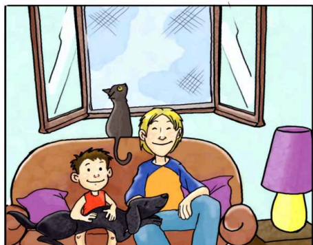
IN CASA USA LE ZANZARIERE ANZICHÉ ZAMPIRONI E FORNELLETTI.